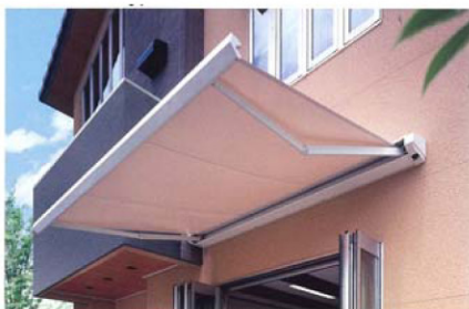
手動式 関東間 開口3,640×呼称奥行1,901(mm) テント生地：防汚テント304 本体：ホワイト ¥245,200(ハンドル長さ1400含む)

日陰の空間をつくりだすオーニングは、夏場でも窓を閉め切ることなく涼やかな外気を取り込むことができます。夏の匂いを感じ、冷房過多で起こる冷房病も防ぐことができます。また、打ち水（雨水やお風呂の残り湯を利用するとよい）で、気温も約2度下がるそうです。